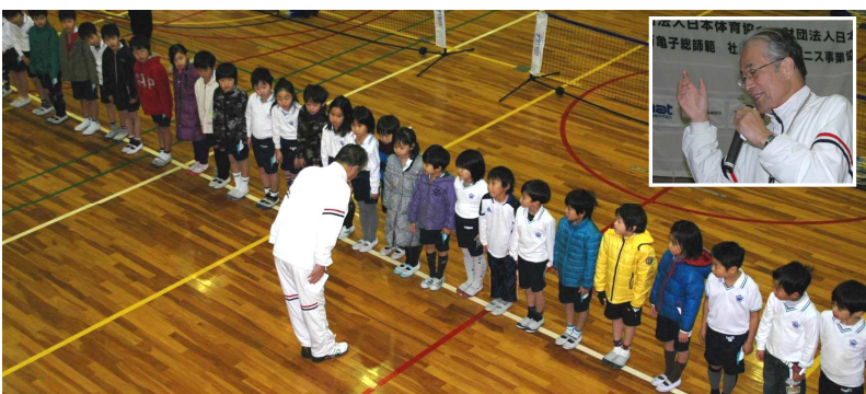
●保護者には「子どもの躰」の講義も