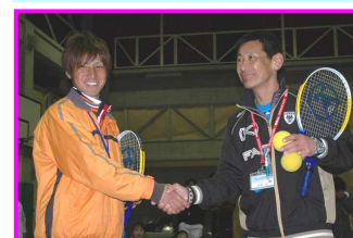
●ITCのスタッフによる「お辞儀のお見本」です。 ●テニスのお見本です。 ●握手は笑顔で♪