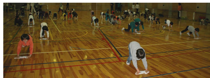
●最後はみんなで雑巾がけ。後片付けもキレイにします。