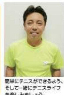
簡単にテニスができるよう、そして一緒にテニスライフを楽しみましょう。