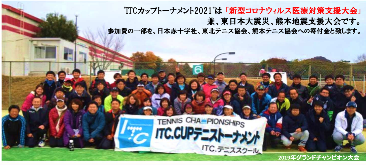
2019年グランドチャンピオン大会

「ITCカップトーナメント2021」は「 新型コロナウイルス医療対策支援大会 」 兼、東日本大震災、熊本地震支援大会です。 参加費の一部を、日本赤十字社、東北テニス協会、熊本テニス協会への寄付金と致します。