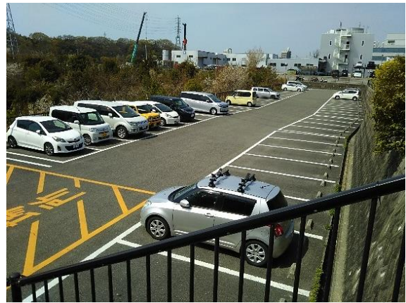
デイキャンプ場駐車場入り口 ※キャンプ用にお停めください デイキャンプ場駐車場