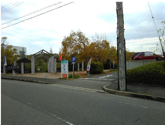
いぶきの森デイキャンプ場入口