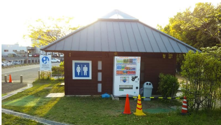
キャンプ場専用トイレ