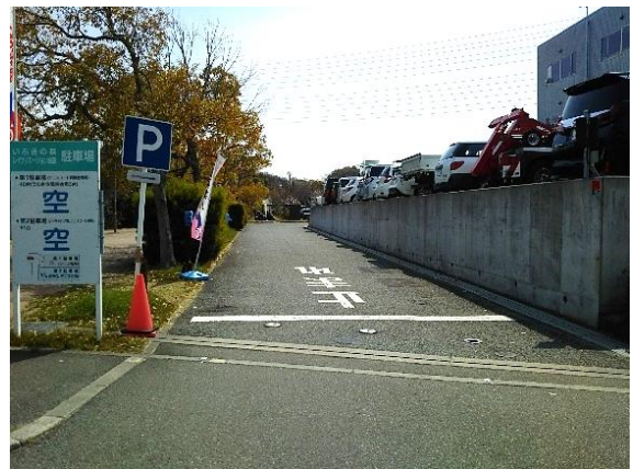
いぶきの森デイキャンプ場進入路